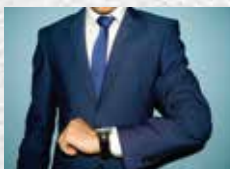
スーツ・衣類・靴