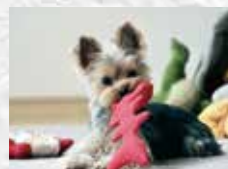
ペット用品・おもちゃ