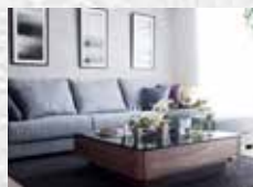
ソファ・カーペット・ドアノブ